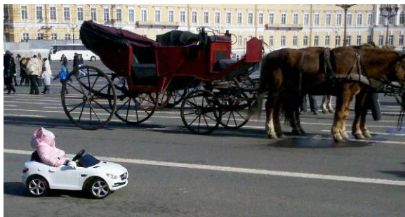
Trafiksituationen utanför Eremitaget

Söndagens kväll ägnade vi naturligtvis åt att äta. Flera av oss hamnade på ett vodkamuseum som dessutom hade alldeles utmärkt mat. Måndag förmiddag gick åt till viss shopping och kompletterande besök i vissa måste besöksställen. Hemresan gick sedan utan incidenter och förseningar. Dessutom kan meddelas att de ryska champagneflaskorna tålde frakt både i handbagage och polletterat. Tryggt att veta för nästa resa.