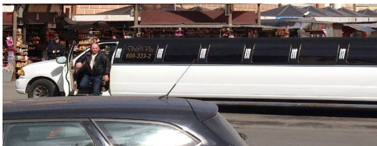
Varför inte satsa på något större?