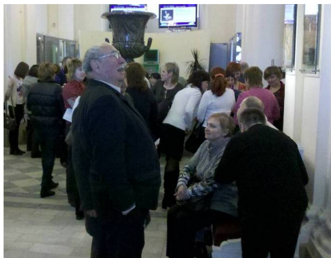
Entusiastisk publik i väntan på första ringningen