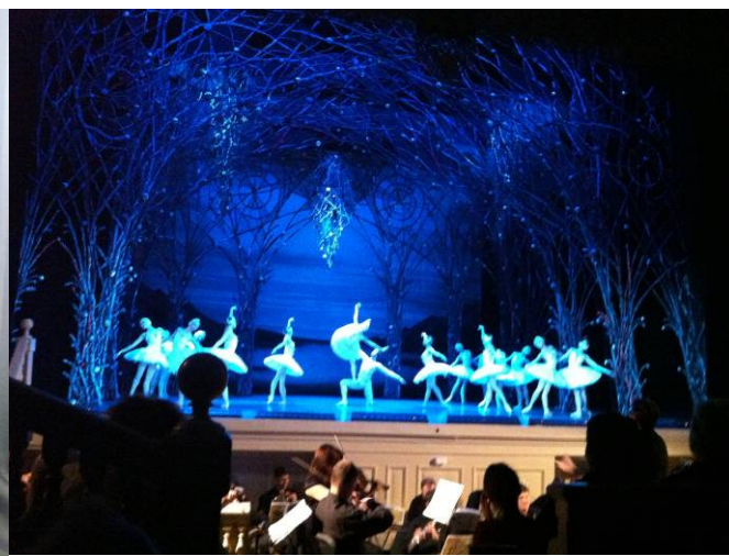
De dansande ”svanarna”